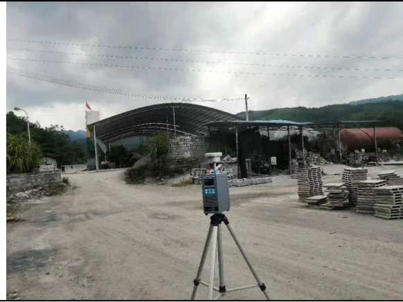
无组织废气采样照片 1