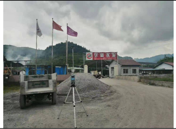
无组织废气采样照片 2