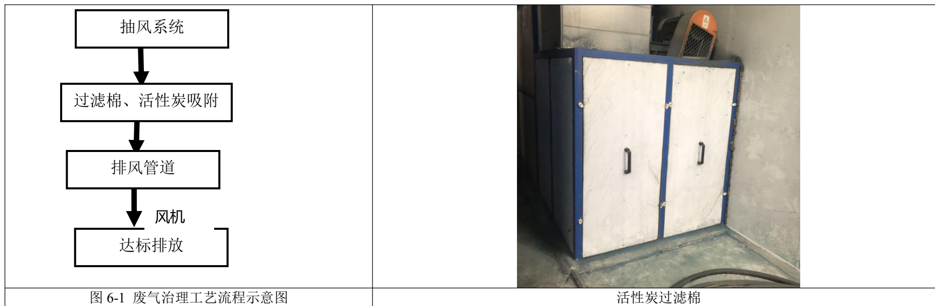
下图 6-1 为项目废气治理工艺流程示意图及对应的设施照片。