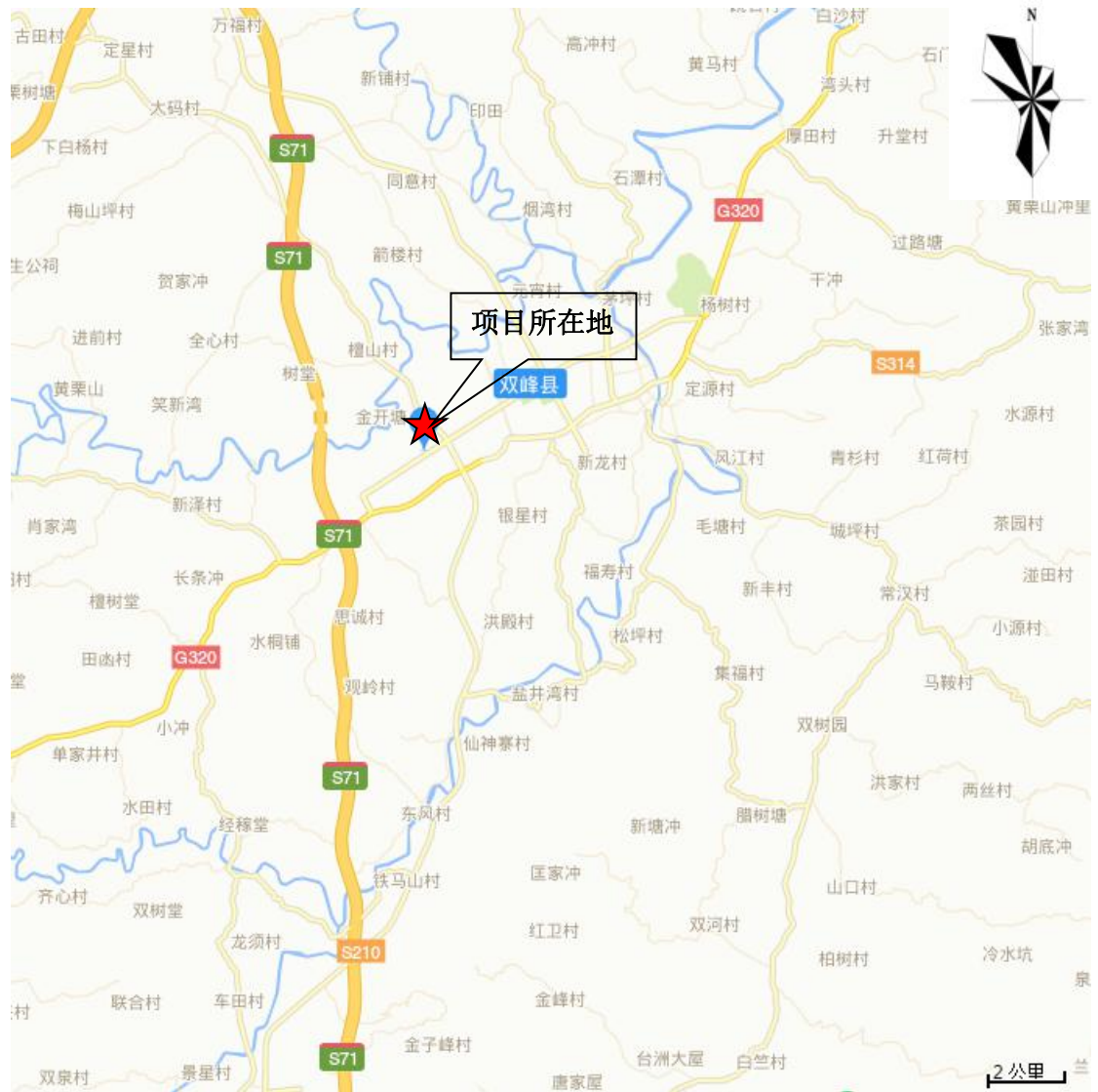
附图 1：项目地理位置图